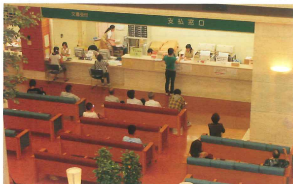
〈写真は県立中央病院の待合室〉

去る7月16日に市役所において山形市選出の県会議員と山形市の執行部並びに市議会の代表者と重要要望事業について話し合いを行いました。地方財政の確立や道路行政の改善含め多岐に亘って、要望実現に向け懇談を行いました。その中でも特に制度改善を図らなければならない1つとして国民健康保険の課題があります。特に、国民健康保険は構造的課題として高齢者や低所得者の加入が多いため財政基盤は大変厳しい現状にあります。